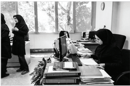
گزارش خبری- لیلای غضنفری

قزل‌سلفی با بیان اینکه فرآیند انتخابات در ۳۲ مرحله طراحی شده و طی ۲۰۹ روز ۱۹ مرحله آن به انجام رسیده است، گفت: در مرحله