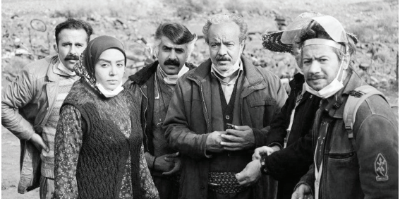
تصویربرداری سریال تلویزیونی «نون خ ۵» این روزها با وجود برف و بوران ادامه دارد.

«قلب رقه» یک اثر مهیج سینمایی است که برای انتقال مفهوم خود یعنی جنایات داعش، به‌راهی درست از تکنیک برسد، صحنه‌های آکشن، لحظات نفس‌گیر تعقیب و گریز، رقابت شرعی و … مواردی هستند که مخاطب را با فیلم همراه می‌کنند. در این رهگذر نیز